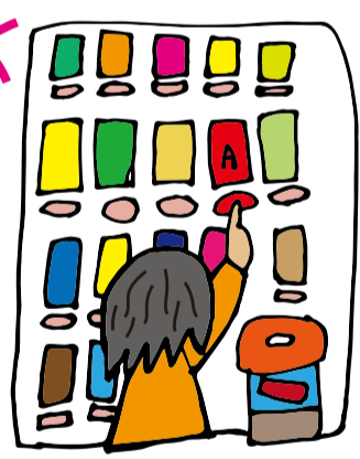
まず、赤いAに狙いを定めま

とにかく買って買って買まくって売り切れにします それを続ける事です 継続は力なり