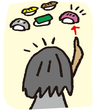
大トロがなければ中トロとにかくと口です いつも入ってたらいいな