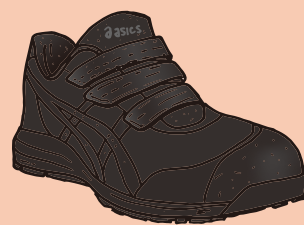
001 ブラック×ブラック