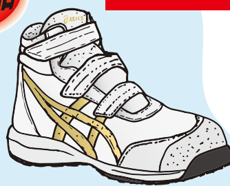
100 ホワイト×ピュアゴールド