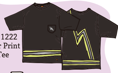
UN2511222 Reflector Print S/S Tee