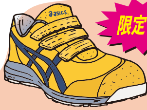
800 アンバー×インディゴブルー