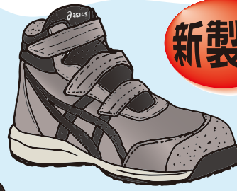
020 トープグレー×グラファイトグレー