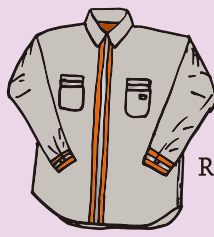
UN2511100 FUNCTION Reflector L/S SHIRT

ユニバーサルオーバーオール 新規プロフェッショナルラインが誕生します。 アメリカワークウェアを追求し、1世紀以上に渡って愛されてきたブランドです。 歴史ある古き良きデザインに、『Hi-Vis』を融合させ、プロ仕様のリアルワークウェアを提案します。 2月に東京で展示会を予定しておりますので、皆さまのご来場を心よりお待ちしております。チラシ同封