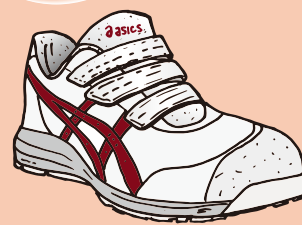
100 ホワイト×ビートジュース