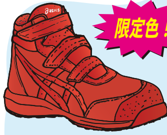
600 クラシックレッド×クラシックレッド