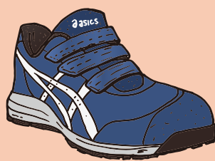
400 マコブルー×ホワイト