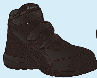
001 ブラック×ブラック